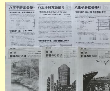
上：八王子肝友会便り 下：東京肝臓のひろば