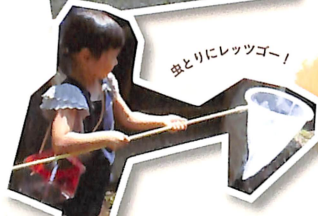
虫とりにレッグゴ!