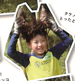
タケノコ とったどー!!