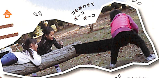
力をあわせて キノコ キーコ