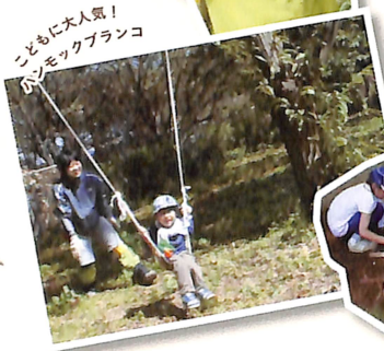
子どもに大人気! タケノコブランコ