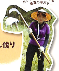
おとななぜかハマる 真夏の草刈り...