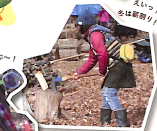
えいっ!! 冬は薪割り!