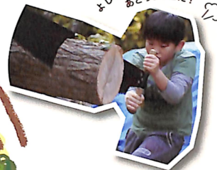
よしっ!! あとちょっとだ!