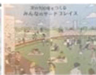
医療刑務所跡地整備計画