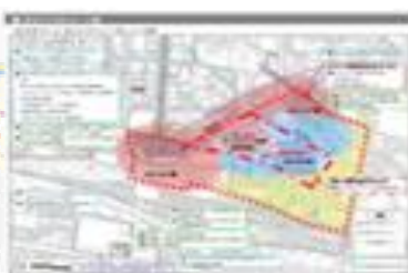
旭町周辺地区整備計画