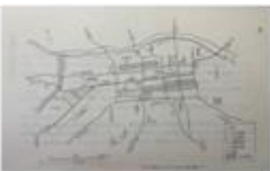
江戸期の八王子宿の町割